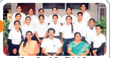
प्रायोगिक परीक्षा में विद्यार्थियों ने किया...